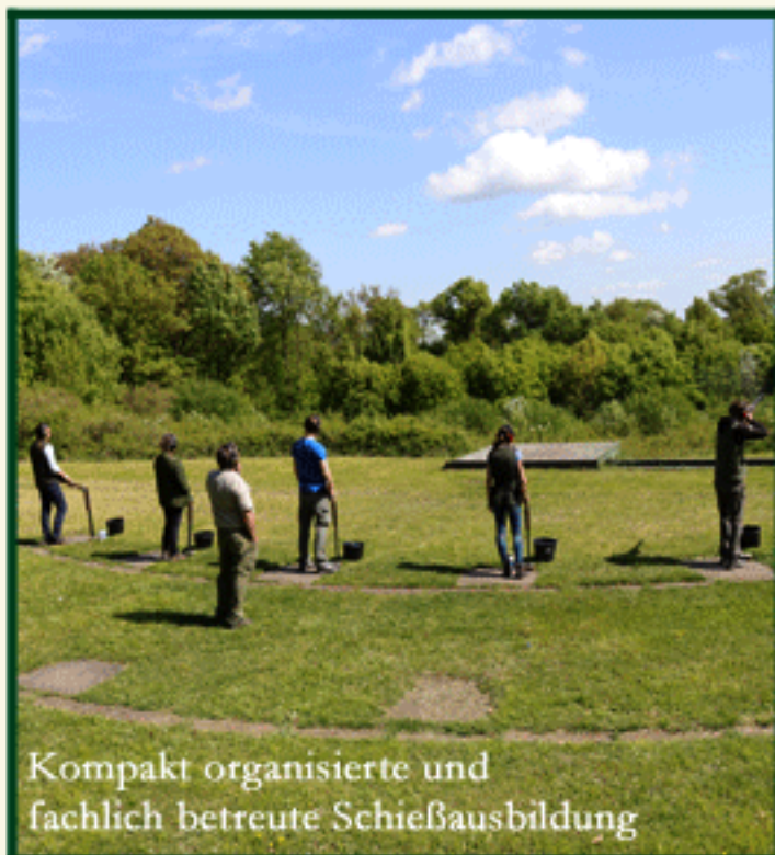
Kompakt organisierte und fachlich betreute Schießausbildung